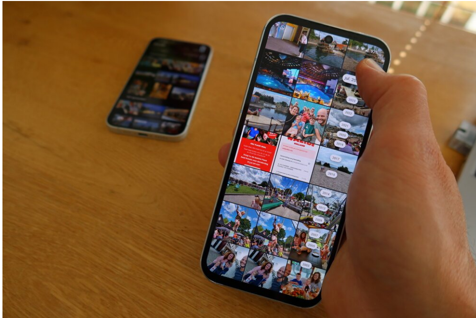
Aves en acción mostrando la potente barra de desplazamiento que permite un desplazamiento rápido y preciso