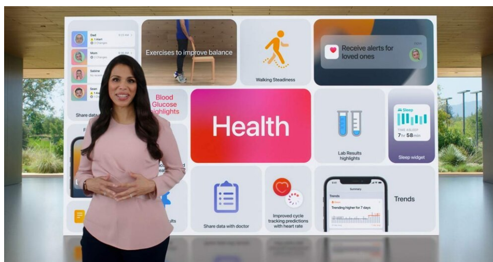
Apple se toma en serio la salud y las fotos (Dra. Sumbul Desai)

Aunque tenía mis razones de viejo cascarrabias para dejar iCloud Fotos, una cosa que creo que Apple entiende bien es lo importantes que son las fotos y los vídeos para nuestro bienestar. En una entrevista en YouTube, la Dra. Sumbul Desai (Vicepresidenta de Salud de Apple) menciona la importancia de las fotos junto al monitoreo cardíaco y la detección de caídas. Los recuerdos de seres queridos pueden hacernos sentir bien. Apple integra esta visión en sus productos con funciones como "en este día" y la esfera de reloj de fotos, que muestra automáticamente diferentes recuerdos. El fácil acceso a tus fotos y vídeos te ayuda a reflexionar y puede ser un antídoto perfecto para otras cosas que puedan causar ansiedad o estrés.