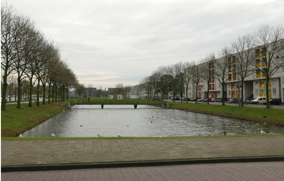
De buurt heeft veel water en groen

Ik vind de buurt erg leuk, ondanks enkele van haar problemen. Je kunt hier eten als nergens anders in Amsterdam, er zijn veel vriendelijke mensen die niet zo gestrest en op zichzelf gericht zijn als ik elders heb gezien. En wat meer is: velen van hen zeggen "hallo" als je ze passeert. Soms zie ik Venserpolder als een klein dorp, en dat is een goede zaak.