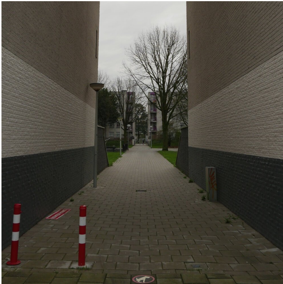
Typisch steegje in Venserpolder, Amsterdam-Zuidoost

zoeken. Ik was niet bang, want ik ben een vrij lange man met een iets meer dan gezond gewicht.