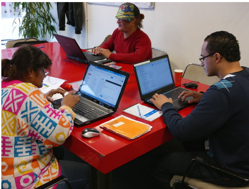
Enkele van de vaste bezoekers van de wekelijkse computerhulpessies

Mijn eerste dag was goed, ik hielp ongeveer drie of vier mensen en werd bijgestaan door een andere vrijwilliger met wat meer ervaring. Maar slechts twee weken na mijn eerste dag vertrok de andere man en runde ik de computerhulp in mijn eentje. Het aantal mensen groeide elke week. Soms hielp ik meer dan 10 mensen tegelijk! Ik herinner me dat ik na elke sessie ging slapen vanwege de pure intensiteit van al dit helpen (dat leren ze je niet op de universiteit, ha!).