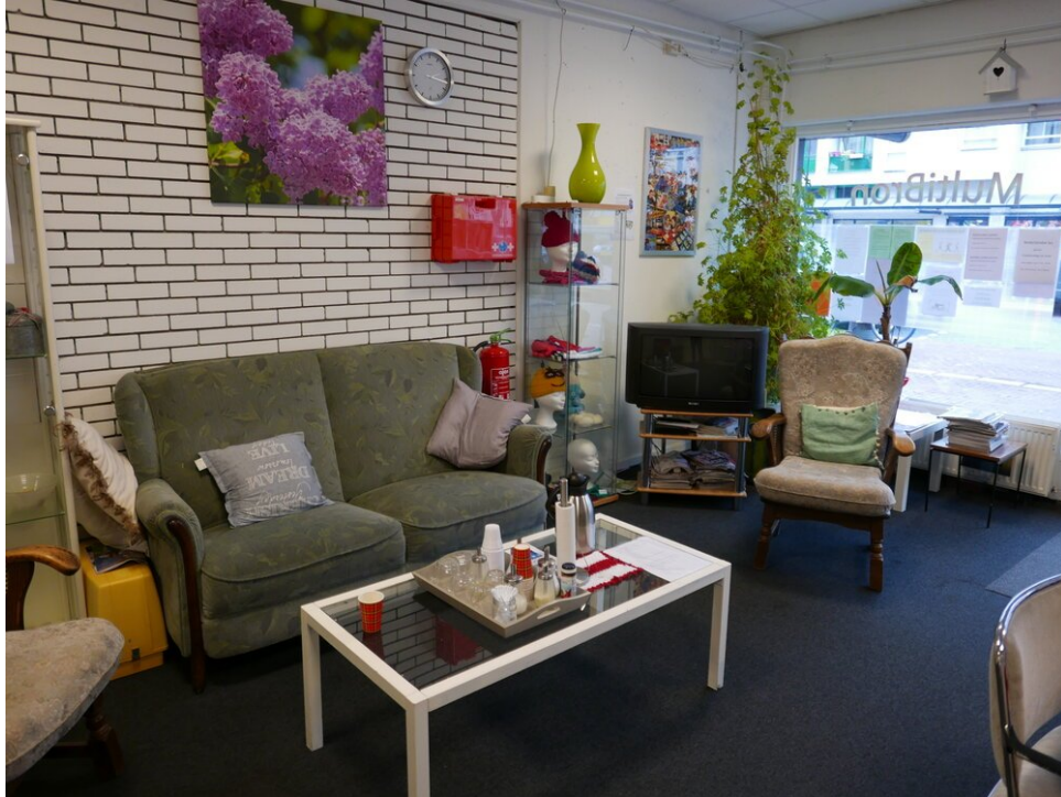
Het buurthuis is als een gezellige woonkamer

In december 2014 riep een folder van het lokale buurthuis op voor vrijwilligers. Het buurthuis kan worden omschreven als een openbare woonkamer met een keuken, gratis koffie en draadloos internet, waar inwoners van de buurt activiteiten kunnen organiseren zoals een breicursus, koken en Nederlandse les.