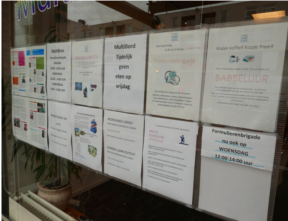
In het buurthuis worden verschillende activiteiten georganiseerd