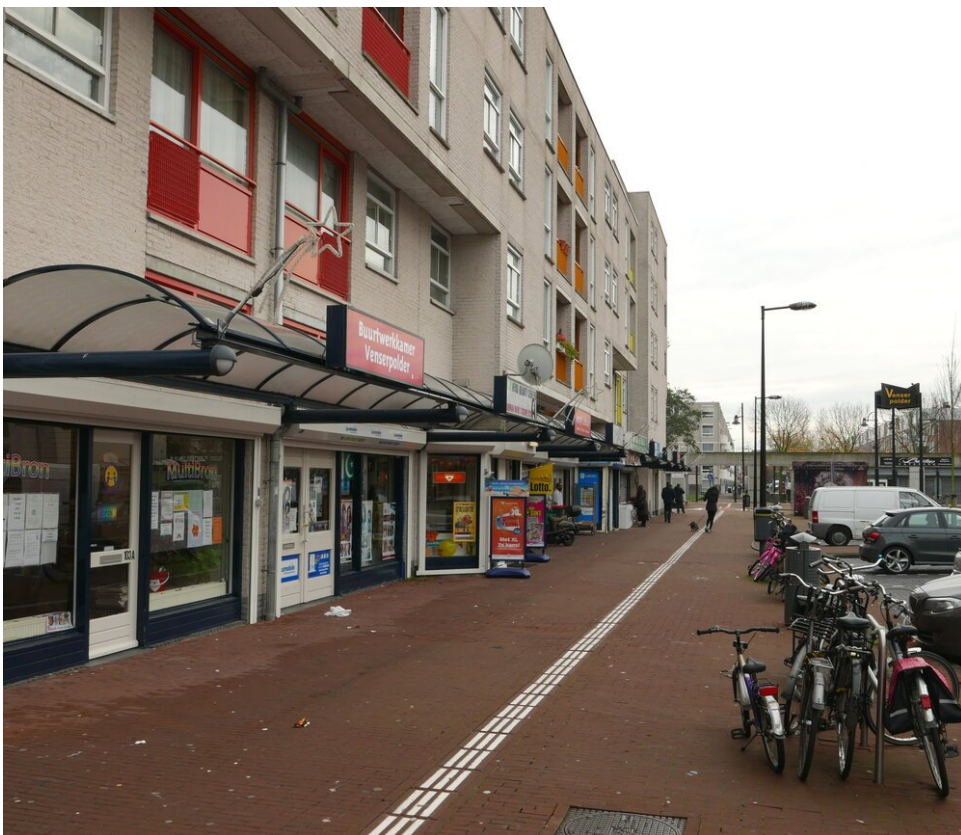
Het lokale buurthuis is gevestigd aan de Albert Camuslaan

Ik vind de buurt erg leuk, ondanks enkele van haar problemen. Je kunt hier eten als nergens anders in Amsterdam, er zijn veel vriendelijke mensen die niet zo gestrest en op zichzelf gericht zijn als ik elders heb gezien. En wat meer is: velen van hen zeggen "hallo" als je ze passeert. Soms zie ik Venserpolder als een klein dorp, en dat is een goede zaak.