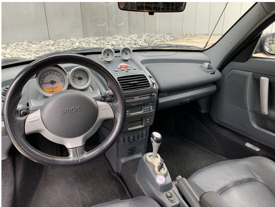
Het interieur van de auto is behoorlijk ruim - zelfs als je lang bent