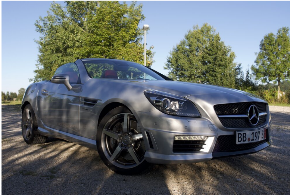
Mercedes-Benz SLK55 AMG V8 5.5L

De kans is groot dat je met verschillende antwoorden komt voor deze verschillende auto's. Dat is het punt: de auto communiceert. Zelfs als je je niet bekommert om de prestaties van je auto als statussymbool, zullen andere mensen dat wel doen. Het is daarom iets om te overwegen wanneer je er een koopt.