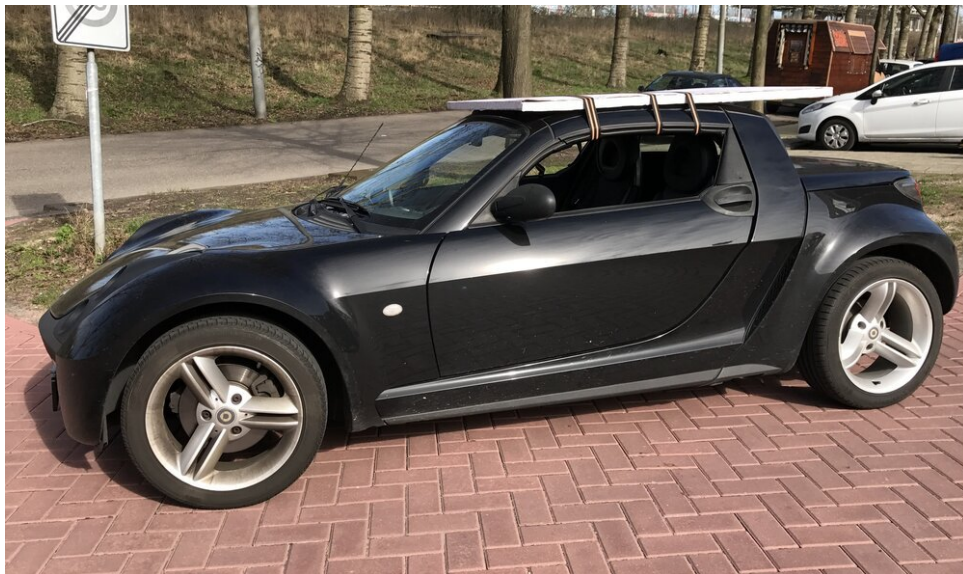
Met drie spanbanden en wat karton, kun je gemakkelijk schilderijen van alle formaten vervoeren