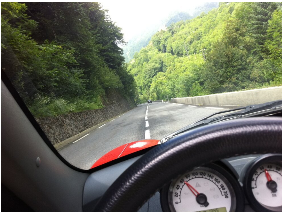
Bochtige bergwegen - puur plezier in een Roadster! (bij de Frans/Spaanse grens)

Als je een bochtige weg vindt ergens in (Zuid-)Europa, zul je het meest genieten van de Smart Roadster. Denk aan een straatlegale achtbaan die je urenlang laat glimlachen!