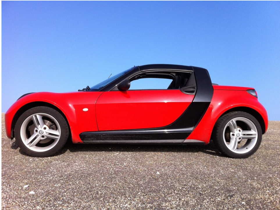
Smart Roadster - vuurrood

De Smart Roadster wordt aangedreven door de Mercedes-Benz turbogebblazen 3-cilinder Suprex motor (60kW, 80PK), die zich achterin de auto bevindt. Het is een kleine motor, maar dat is de auto ook, met een gewicht van ongeveer 800KG. Gecombineerd met de achterwielaandrijving, gripvaste banden en een F1 flipper-schakelbak, is dit een ideale mix voor rijplezier!