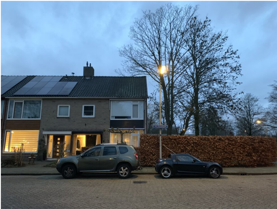
De komst van de gezinsauto...

landweggetjes in Zuid-Europa, zijn de drukke straten in Nederland tegenwoordig veel minder leuk om te rijden. Verkeer, verkeersdrempels, snelheidslimieten en afgeleide bestuurders vragen je constante aandacht, waardoor het plezier verdwijnt.