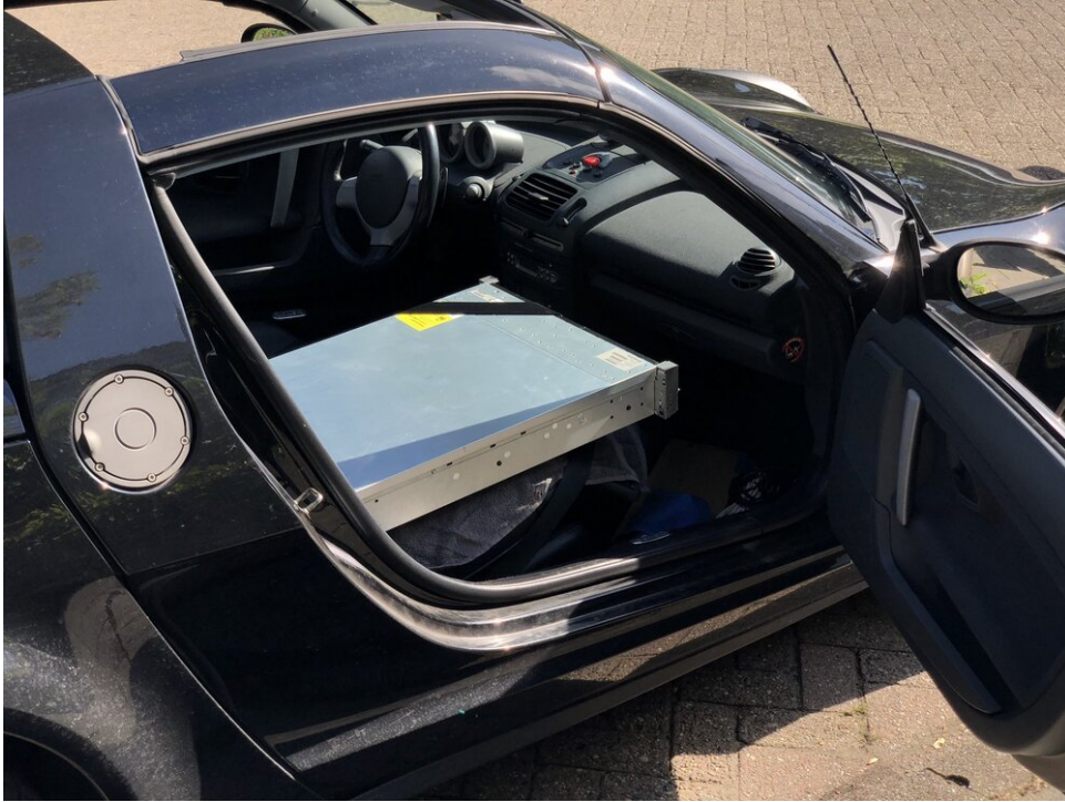
Laat je vriendin thuis wanneer je grotere, belangrijkere dingen moet vervoeren, zoals deze HP DL380 Gen8 server