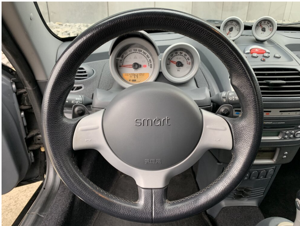
Smart Roadster stuur - let op de F1-stijl schakelpaddles

Hoewel het een kleine sportwagen is, is het interieur best oké, zelfs als je wat langer bent (zoals ik ± 1,93M). Op het dashboard zijn extra meters die bijdragen aan de sportauto-vibe.