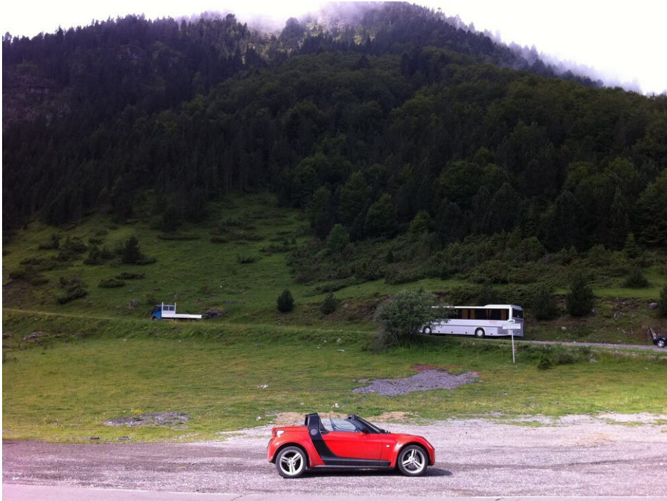
Rijden met mijn Smart Roadster in de Pyreneeën (Frankrijk)

Als je een bochtige weg vindt ergens in (Zuid-)Europa, zul je het meest genieten van de Smart Roadster. Denk aan een straatlegale achtbaan die je urenlang laat glimlachen!