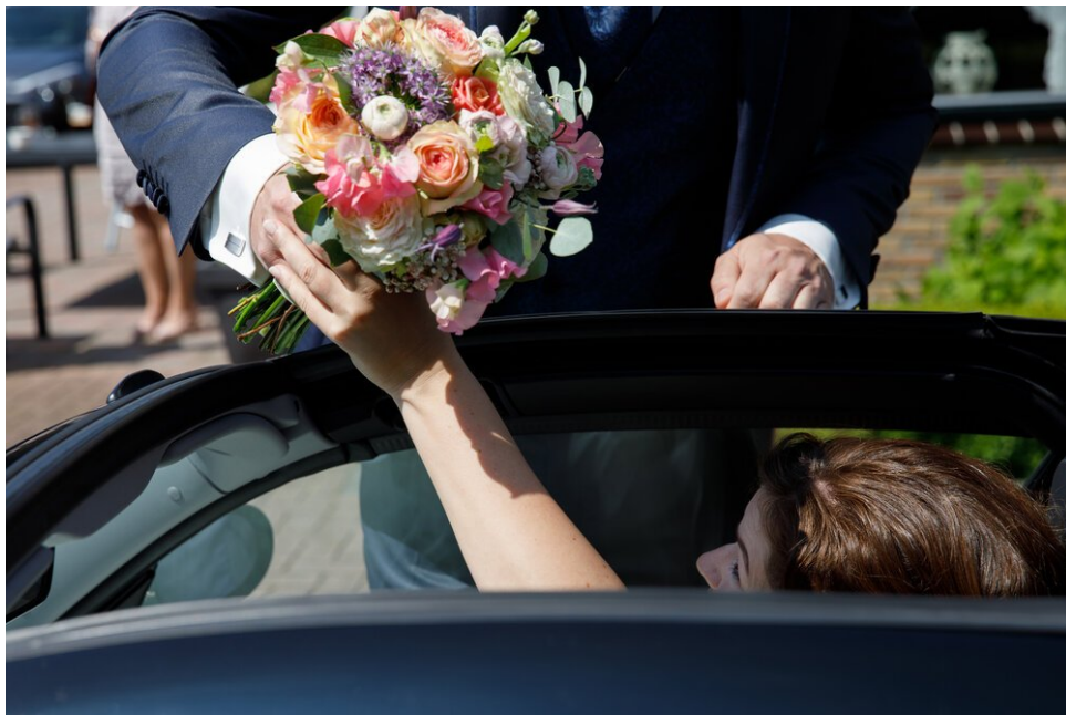
Het open dak fungeert ook als een ergonomisch laadluik