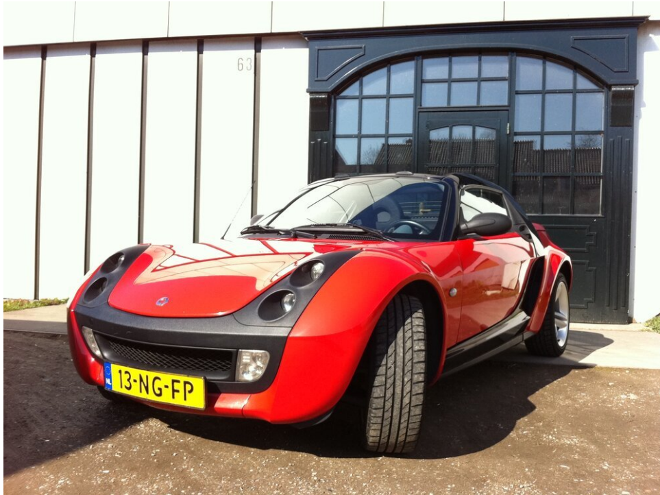
Gripvaste banden zorgen voor veel contact met het asfalt