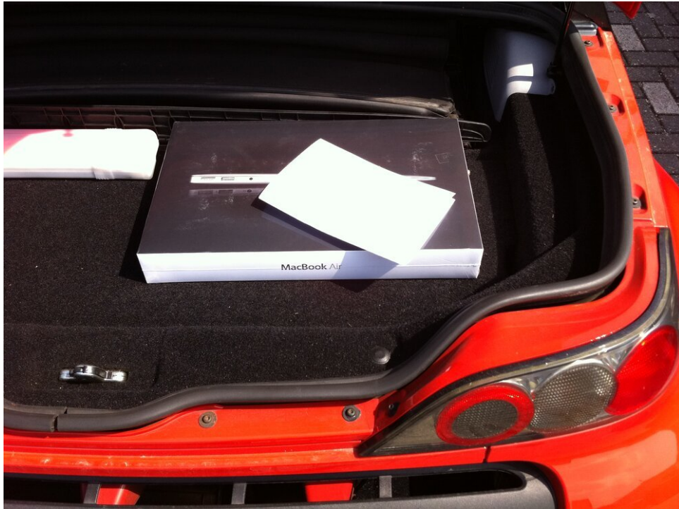
De ruime kofferbak is groot genoeg voor een laptop of twee