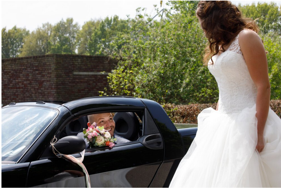
Als je de juiste bloemen gebruikt, vind je misschien zelfs een leuke bruid!