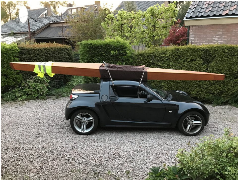
Wie heeft er nou een boottrailer nodig?