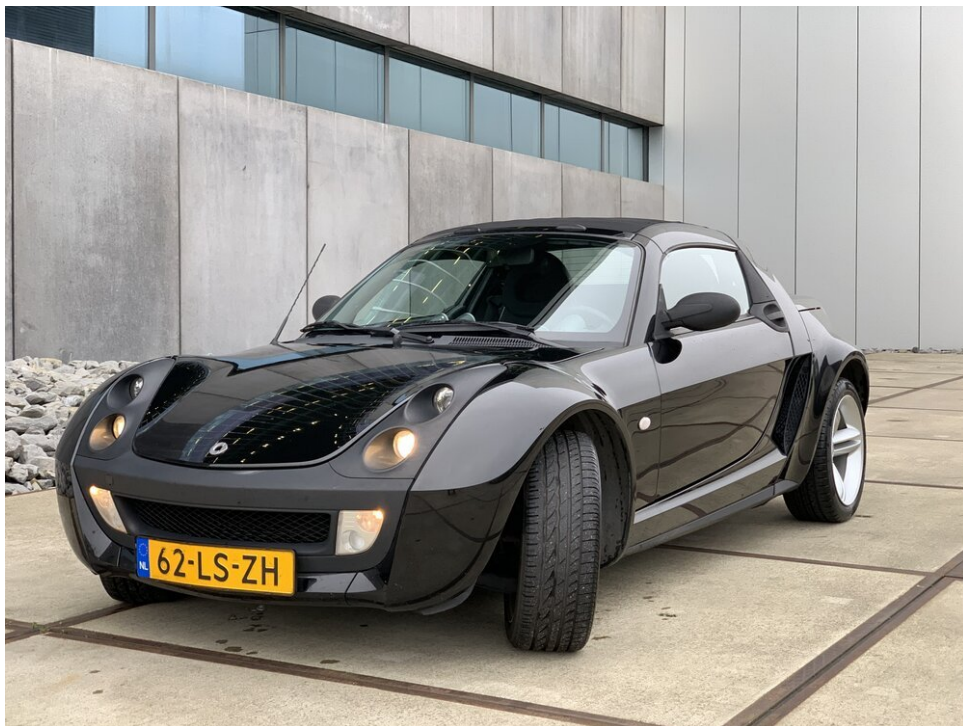
Smart Roadster - volledig zwart