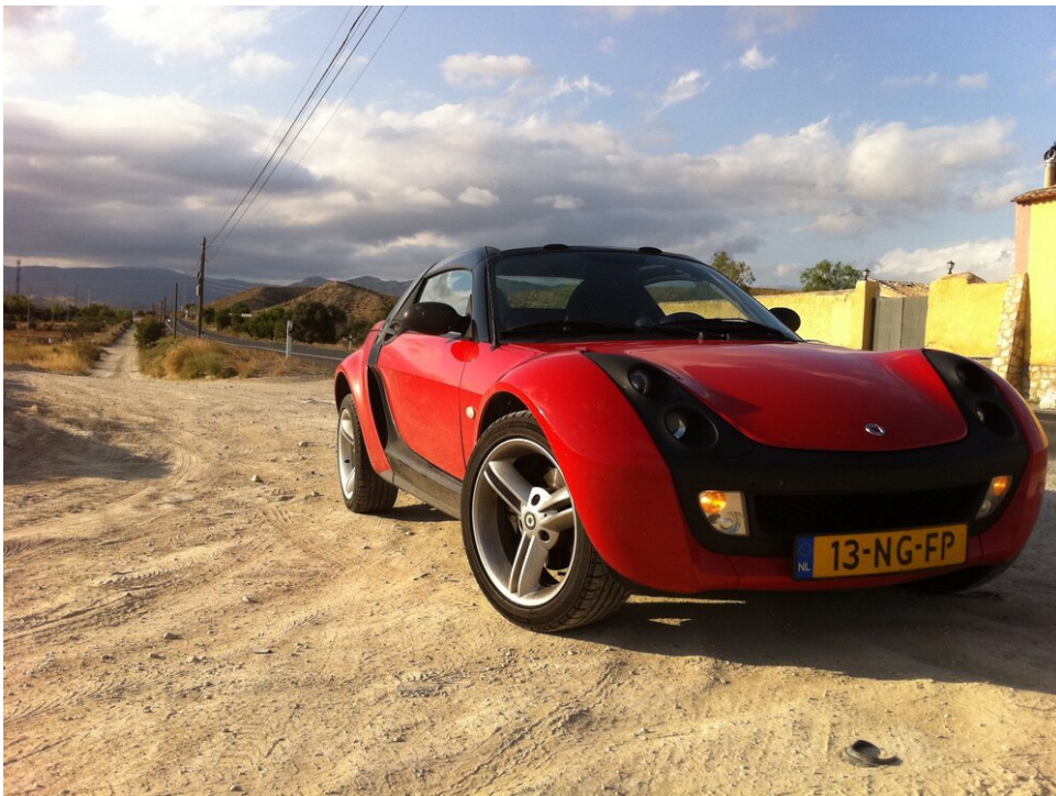
Zorg ervoor dat je de snelweg overslaat, neem de binnenwegen (in Spanje, in de buurt van Alicante)