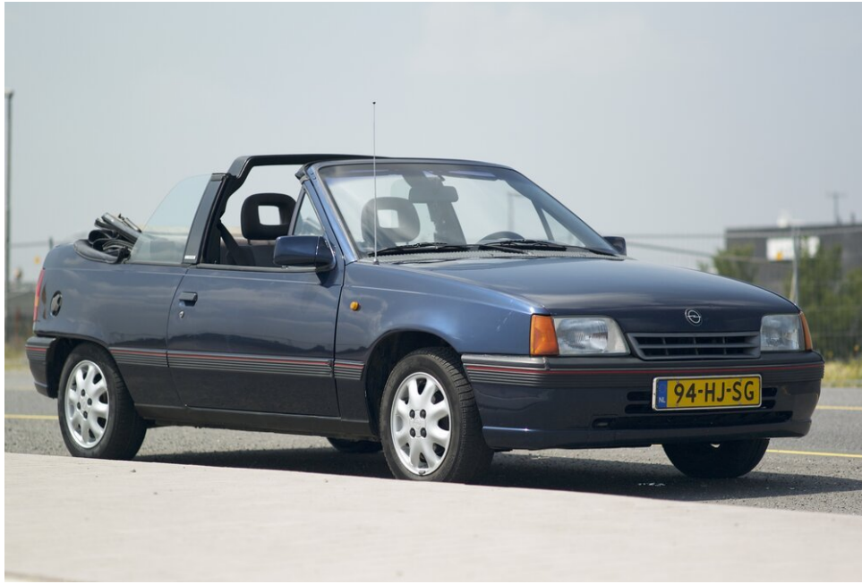
Opel Kadett Cabrio 1.6i Bertone