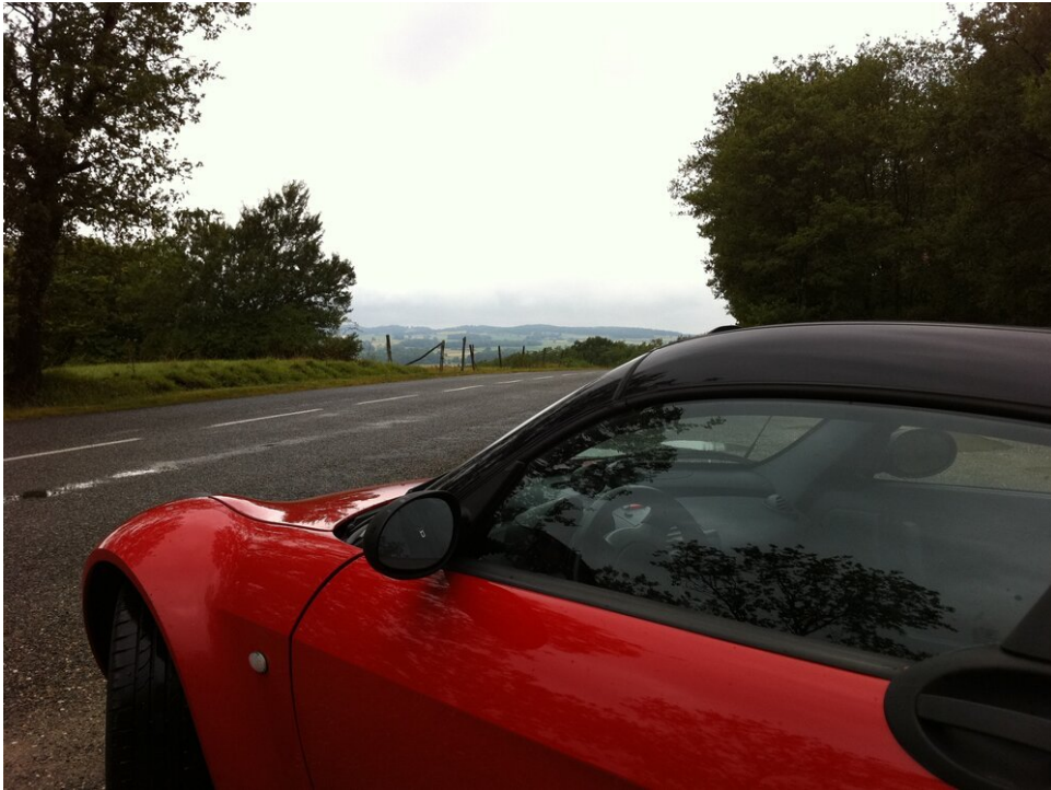
Genieten van een beetje 'op en neer' in het heuvelachtige landschap