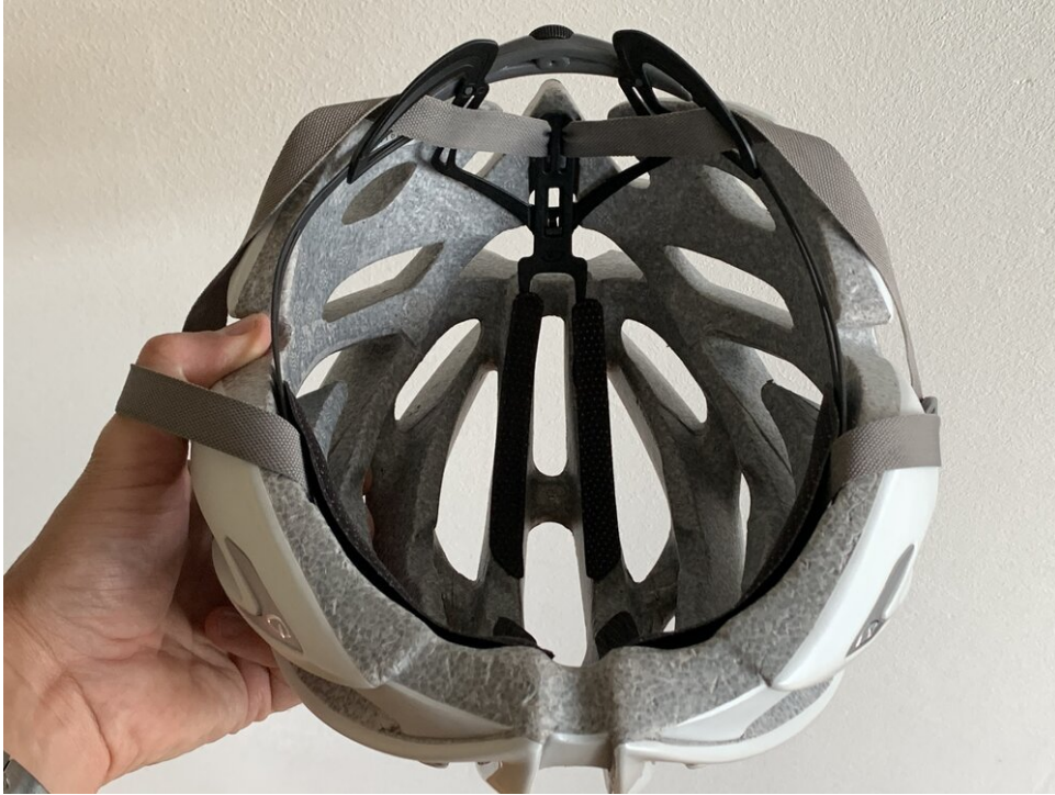
Nieuwe Roc Loc 5 geïnstalleerd