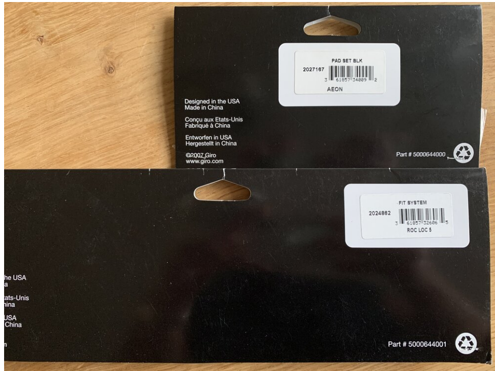
Voor degenen die geïnteresseerd zijn, dit is een foto van de barcodes + onderdeelcodes van het Roc Loc 5 systeem en de padding set