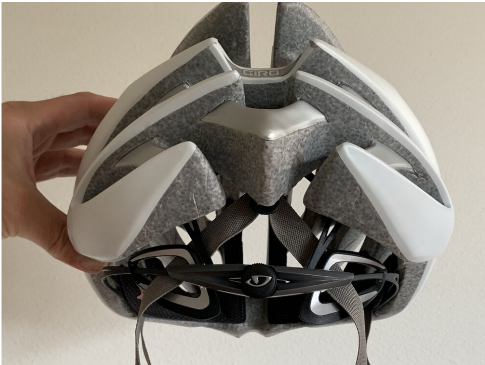
Achterkant van de helm, let op hoe de band door de Roc Loc 5 gaat