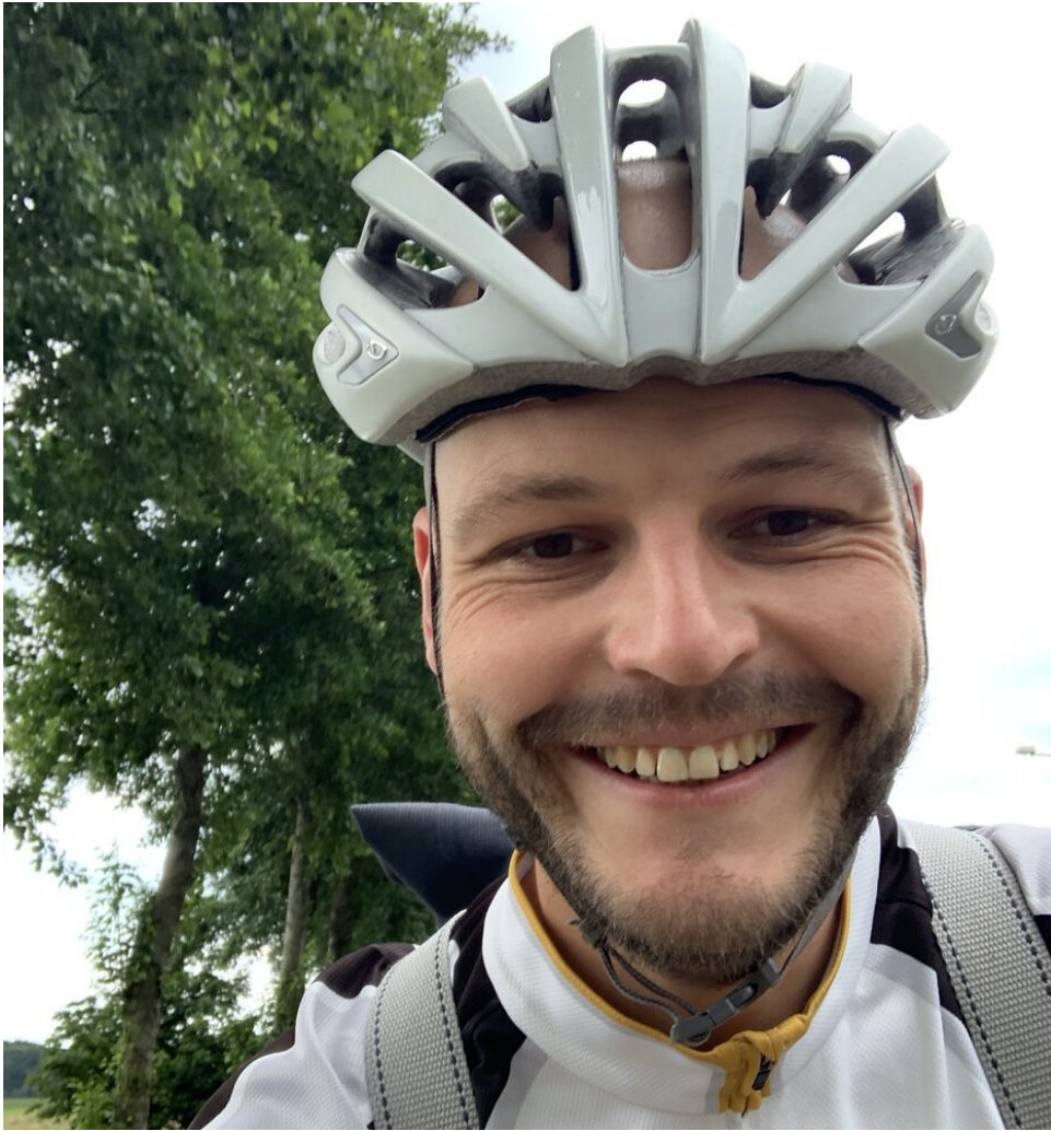
Mijn helm weer dragen!