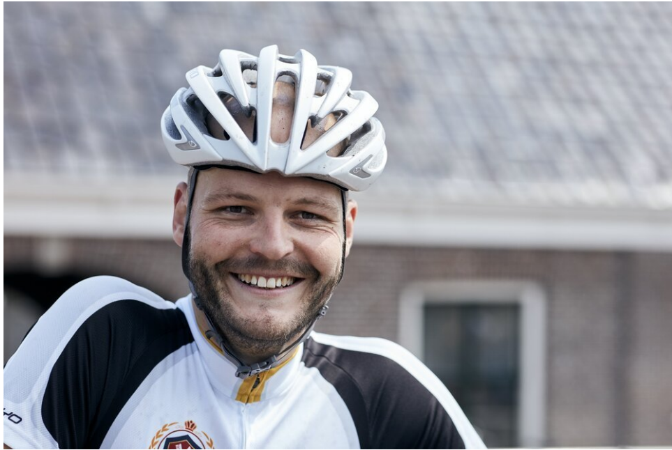
Het dragen van de Giro Aeon helm