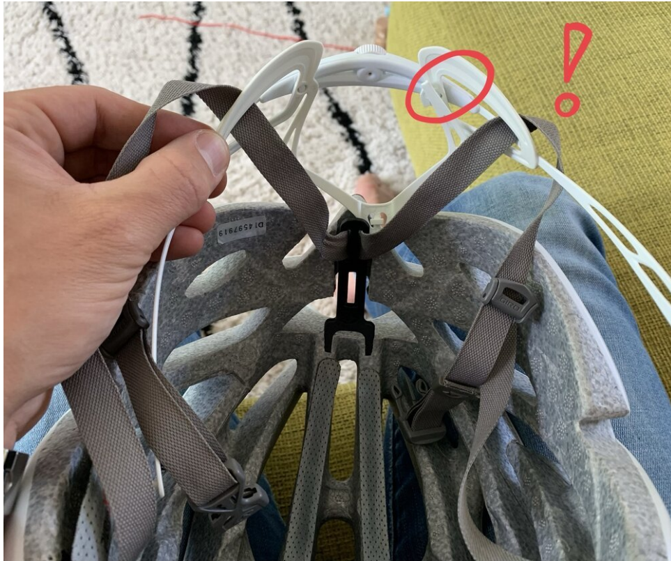
De Roc Loc 5 kapot in mijn Giro Aeon helm