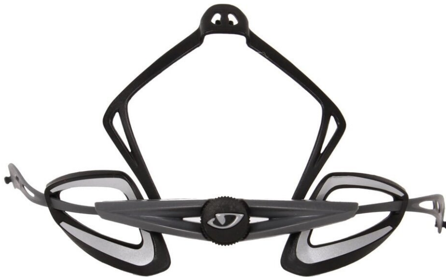
Roc Loc 5 - probeer dit onderdeel maar eens op internet te vinden...

Het enige andere wat ik kon bedenken was het vervangen van het defecte Roc Loc 5 systeem. Toen de helm nieuw was, zou dit een fluitje van een cent zijn geweest. Gewoon een nieuw onderdeel bestellen "et voila". Maar Giro produceert de Aeon niet meer, en handig genoeg gebruiken nieuwere modellen niet het Roc Loc 5 systeem... dit ruikt naar geplande veroudering voor mij, bleh!