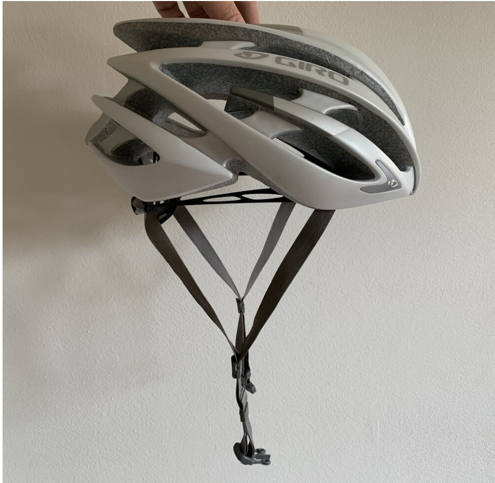
Zijaanzicht van de helm

Terwijl mijn nieuwe Roc Loc 5 werd verzonden, vond ik nog een winkel die nieuwe oude voorraad padding voor mijn Aeon-helm verkocht. Een nieuwe set padding zou mijn helm weer als nieuw laten voelen (en ruiken)!