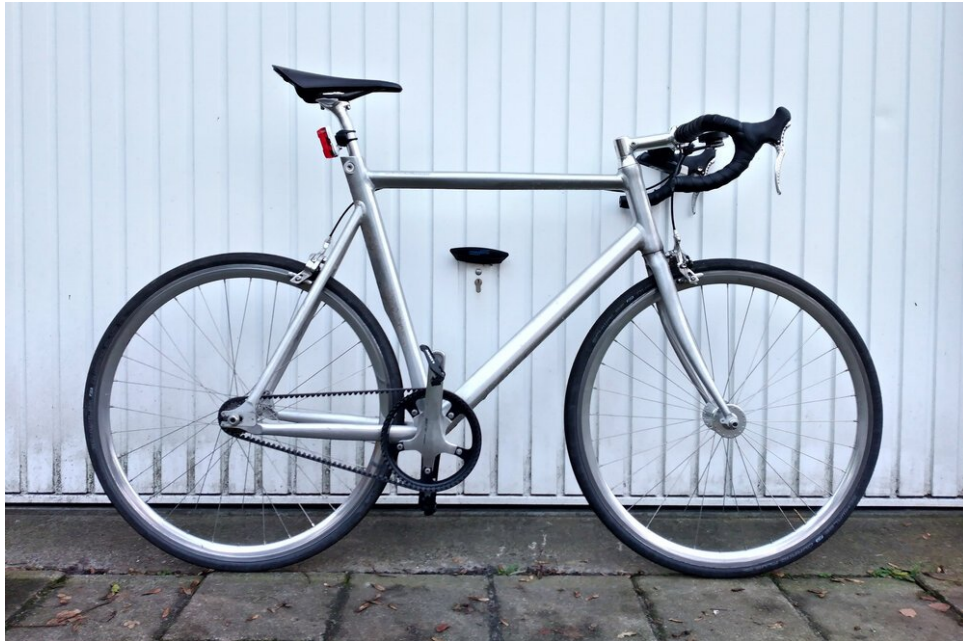
Schindelhauer Siegfried Road - een fixed gear fiets met Gates Carbon riemaandrijving

Deze keer besloot ik het echter wat hardcore te doen... op een fixed gear road bike ! Dat betekent dat, ongeacht het weer, de wind of de pijn die je lijdt, er maar één versnelling is. Harde wind? Harder trappen! Berg af? Sneller trappen! Pijn? Grommen!! GRRRRRR!