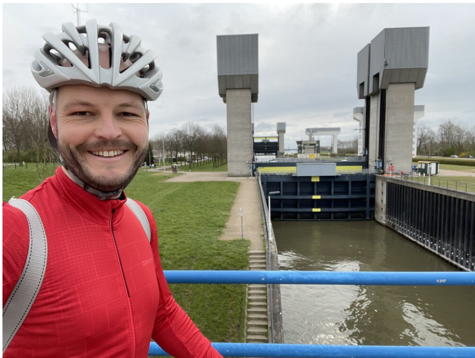
De machtige “Prinses Irenesluizen” verbinden het Amsterdam-Rijnkanaal met de zuidelijke rivieren van Nederland, Lek, Waal en Maas