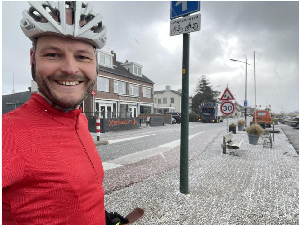
Trainen door ijzige hagel... (Haarlemmermeerpolder)