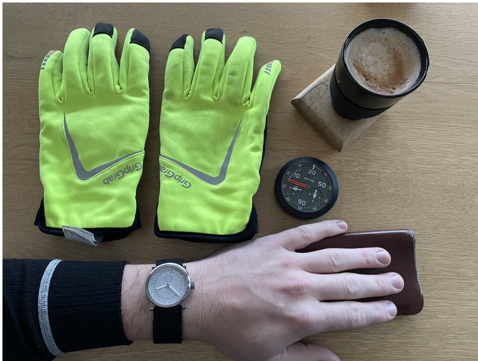
Klaar voor vertrek: Koffie en 176 kilometer te gaan!

waar ik genoeg eten meenam, besloot ik te vertrouwen op mijn vermogen om onderweg voorraden te vinden.