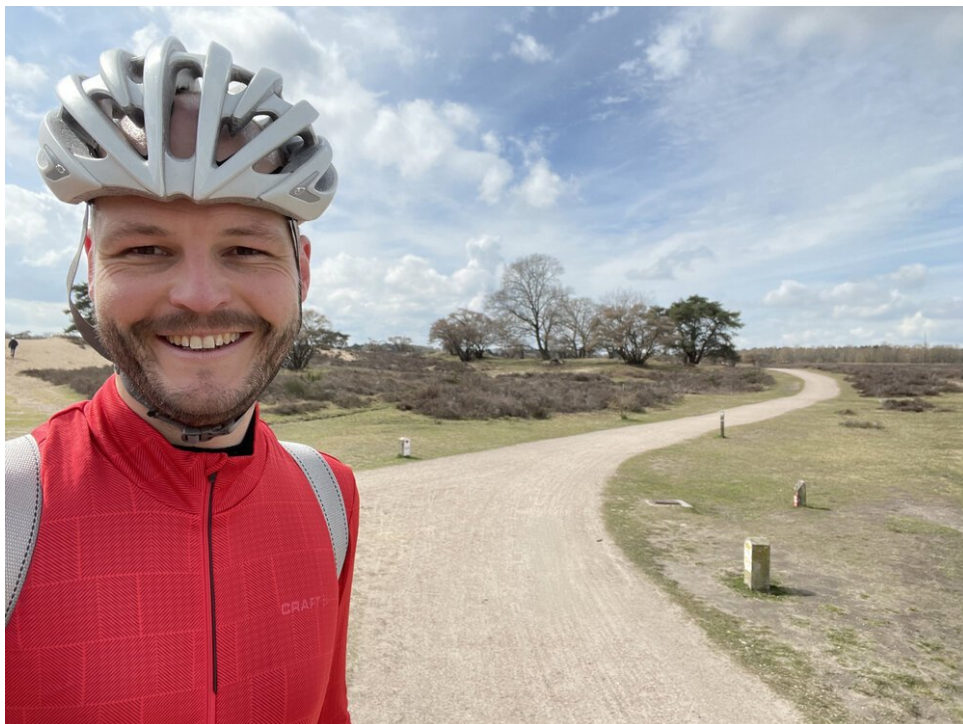
... en door stralende zonneschijn! (Zuiderheide, bij Laren)