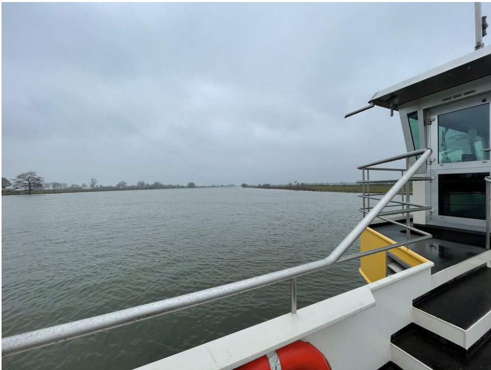
De laatste rivier oversteken met de pont