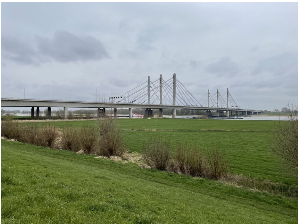
Brug over de Waal bij Nijmegen