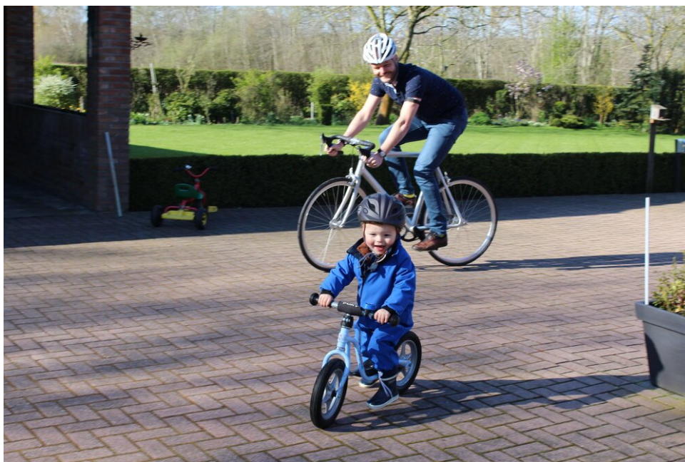
Papa arriveert op de fiets, inspiratie voor de volgende generatie!

Finish en voel je overwinnaar, een blijvend gevoel dat toekomstige ambitie voedt! Klaar voor de volgende uitdaging, wat die ook mag zijn!