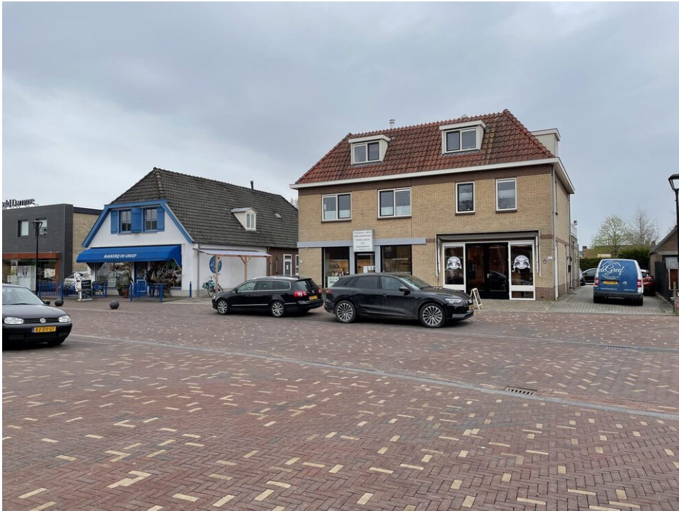
Heerlijke croissants in Kesteren's lokale bakker, Bakkerij de Greef!