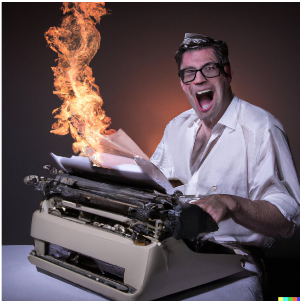
Een gekke nieuwsredacteur met een typemachine die een brandende krant leest