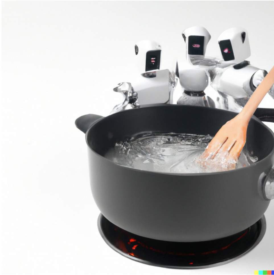
Een foto van humanoïde robots die water koken in een grote pan op een witte achtergrond