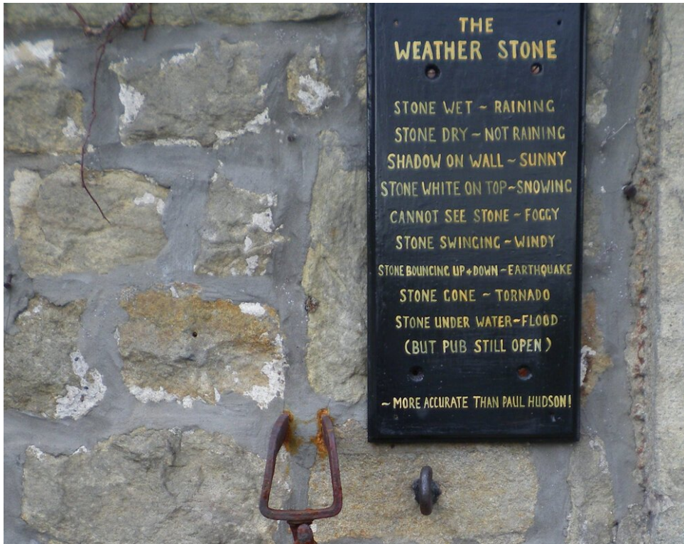
Weersteen - nauwkeuriger dan je favoriete app