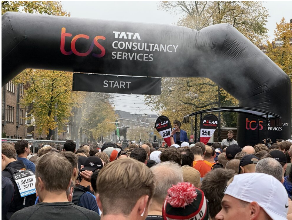
Momenten voor mijn officiële start aan de Stadionweg