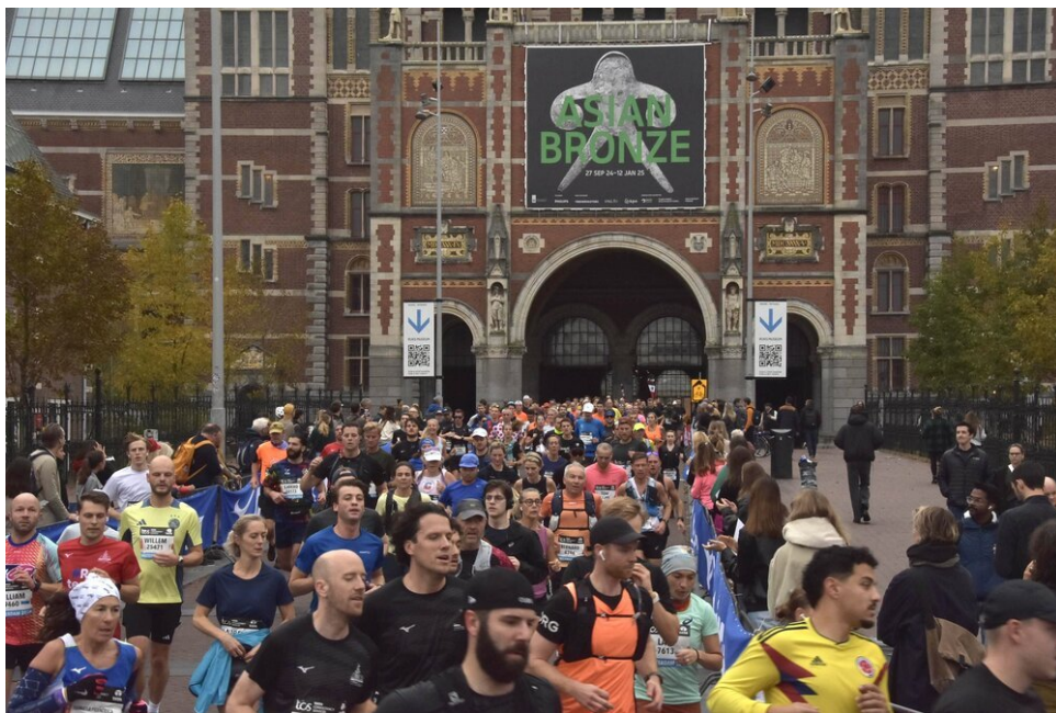
Laten we het spel "Waar is Willem?" spelen :-)