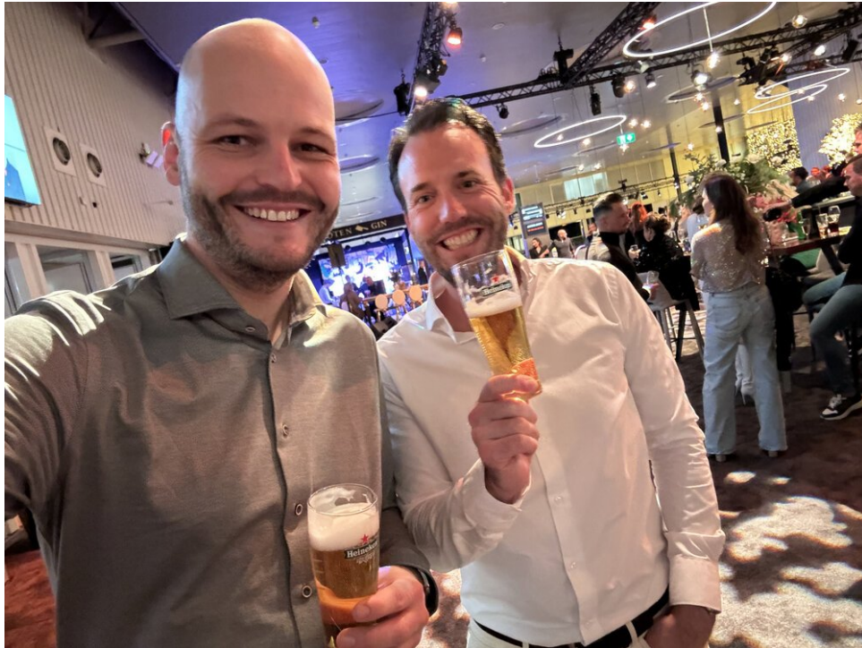
Hoe geweldige ideeën ontstaan: een paar mannen met een paar biertjes

Misschien was het het heerlijke biertje, misschien was het wijsheid, maar het idee leek vanaf het begin geweldig! Het enige (kleine) probleem was dat ik nog nooit serieus had hardgelopen. Kon ik mijn ervaring met fietsen omzetten in iets nuttigs voor hardlopen?