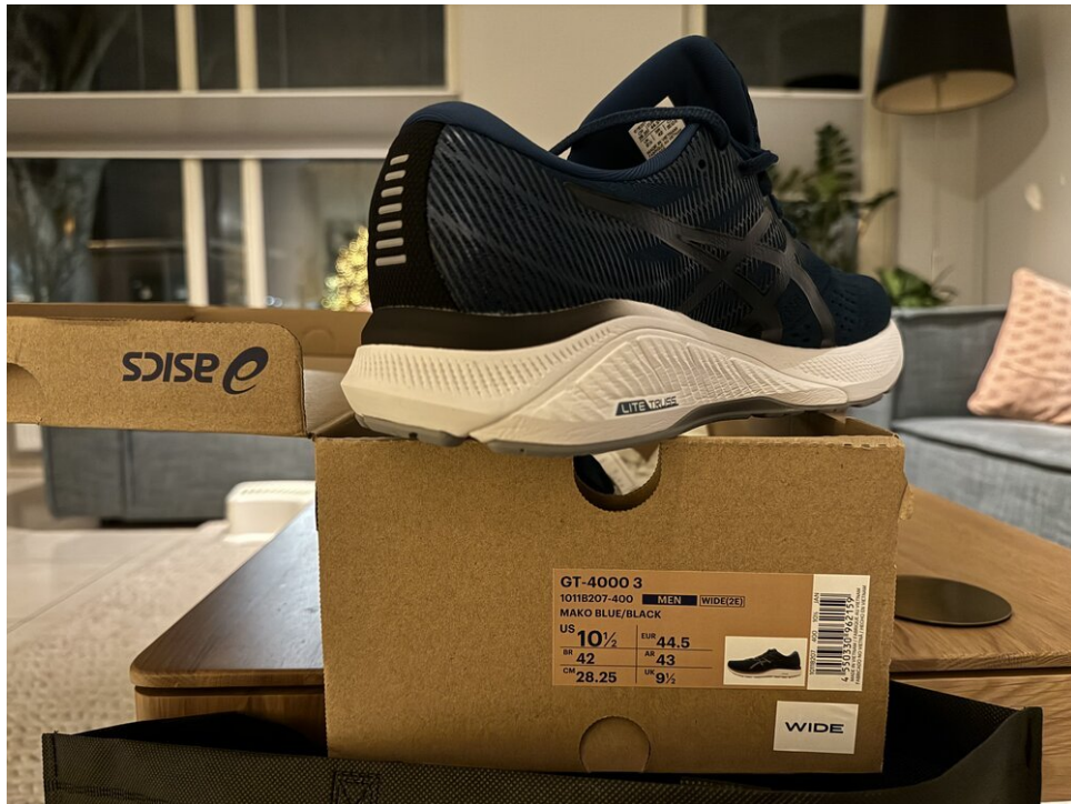
Mijn Asics GT-4000 in mako blauw/zwart, extra breed (2e)

Mijn eerste training was een 5K rond mijn kantoorgebouw in Amsterdam. Veel professionele coaches zouden een beginnende hardloper adviseren om met een kortere afstand te beginnen en geleidelijk op te bouwen... Ik wilde weten waar ik stond, negeerde alle adviezen en ging gewoon vol gas om te zien hoe 5K zou voelen - gezien mijn ervaring als fietser. Man, dat was slecht.