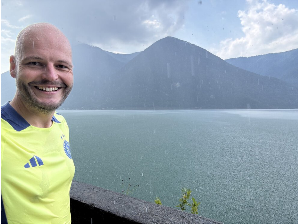
Hardlopen in de regen aan het Lago Maggiore in Italië