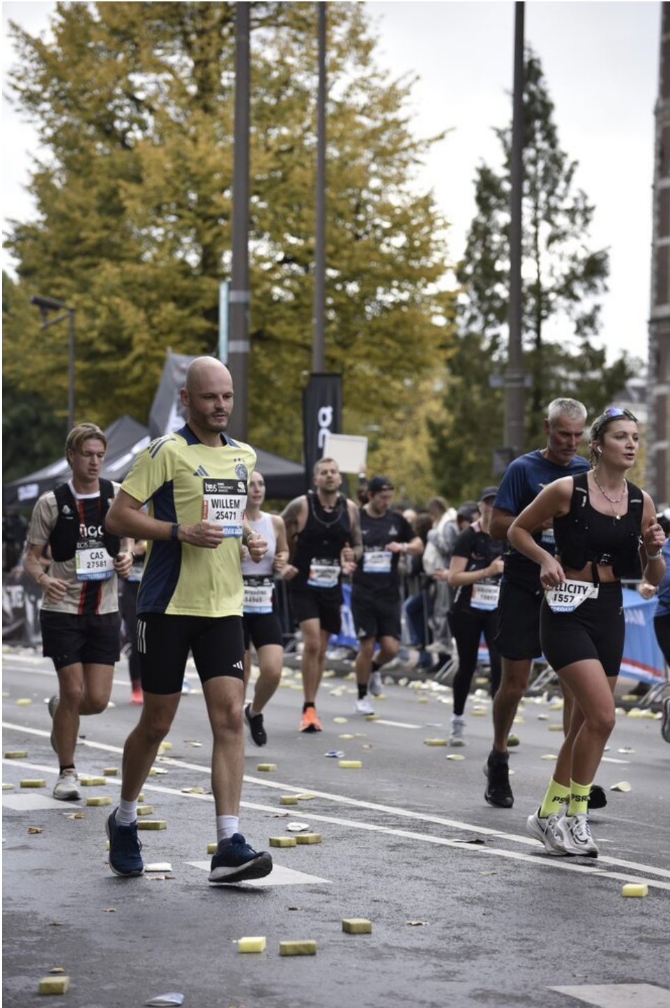
Tussen 30 en 40 kilometer vechten lichaam en geest samen om de finish te halen