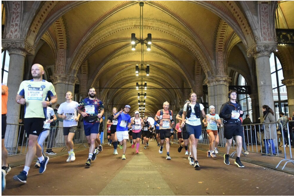
Hardlopen in de Rijksmuseumtunnel - dat is best cool