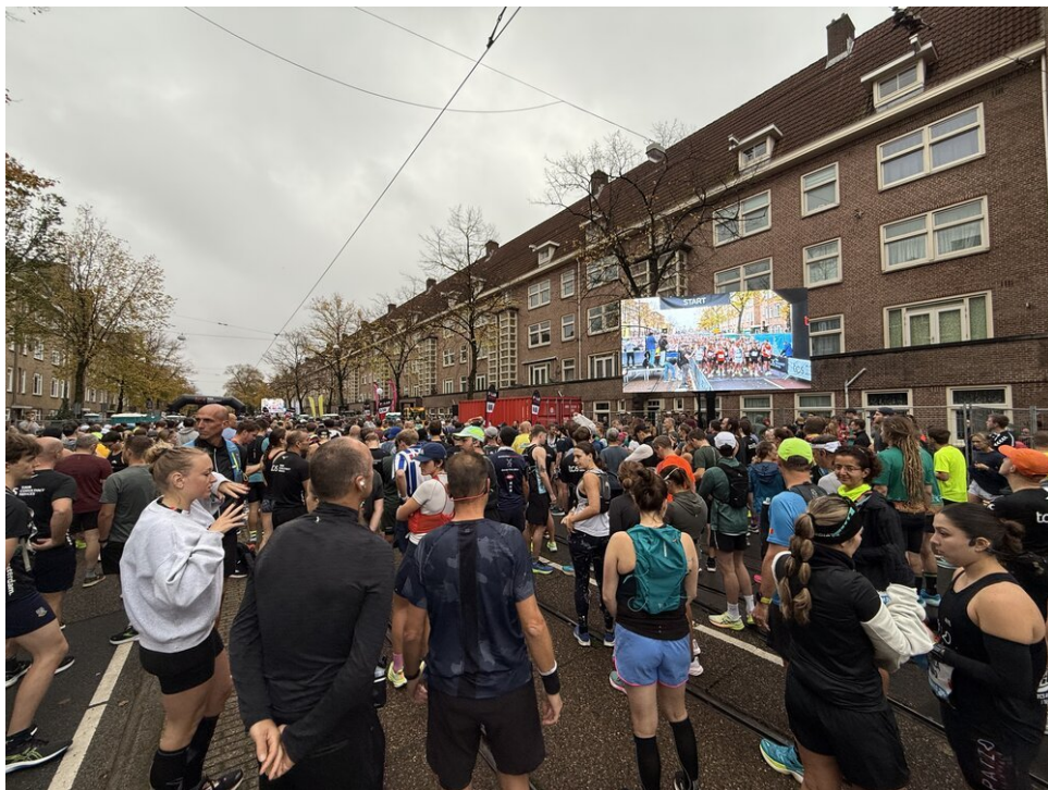
Veel mensen op straat, velen met een gezonde spanning in hun houding