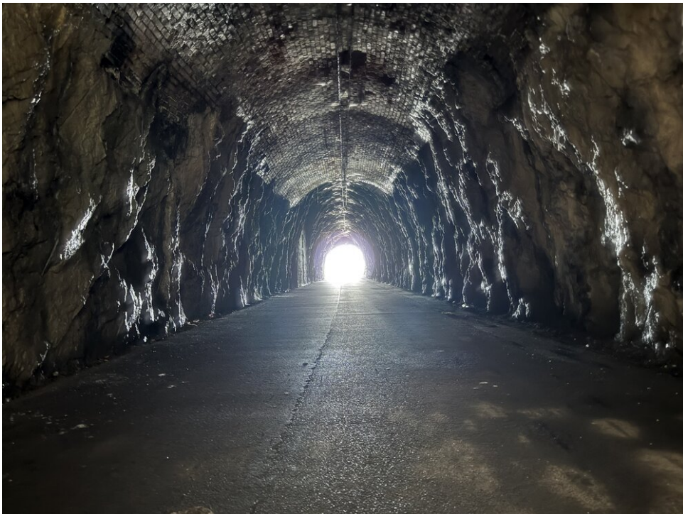
Marathon training: geen berg te hoog - gewoon door de tunnel... :-)