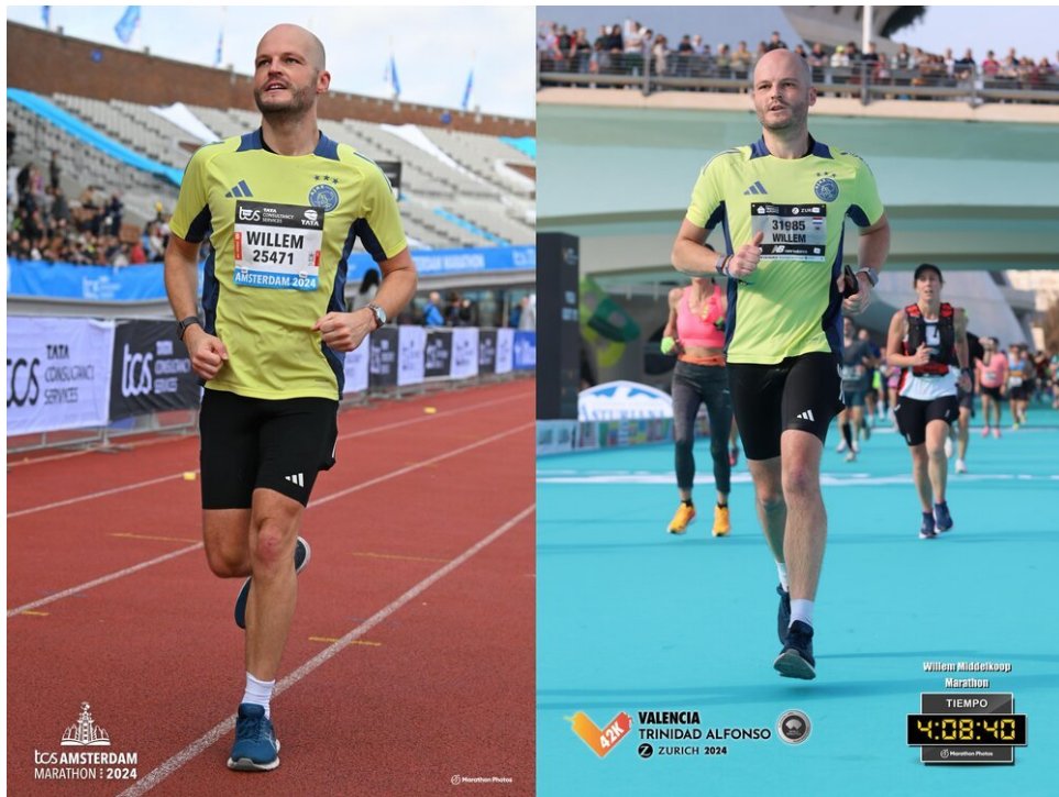
2 Marathons uitlopen in 6 weken (Links: Amsterdam, Rechts: Valencia)

Maar uiteindelijk hoop ik dat ik door meer ervaring op te doen, mezelf en mijn lichaam goed genoeg zal kennen om dit zonder data te doen. Om topprestaties te leveren door lichaam en geest in balans te brengen. Dit is iets om voor te rennen, ha!