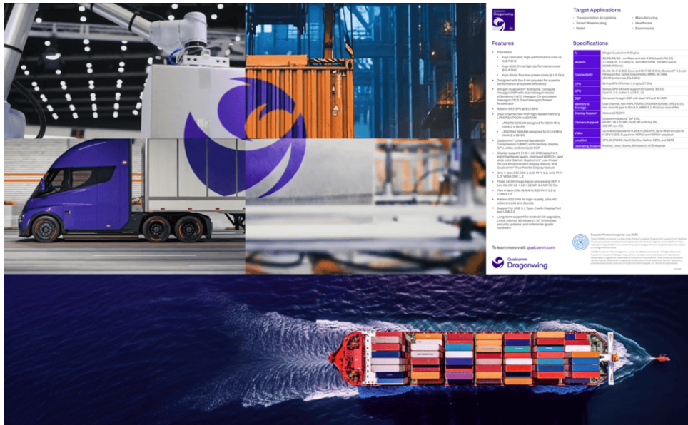
Fairphone wordt aangedreven door dezelfde Dragonwing-chip die wordt gebruikt in schepen, kranen, drones en industriële installaties