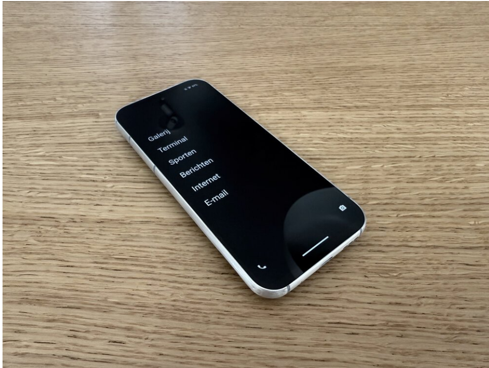
Mijn Fairphone 5 in naturel aluminium met de unLauncher op Google-vrije /e/OS

Overweeg je een Fairphone te kopen? Als je deze link gebruikt, krijg je €50 korting: shop.fairphone.com .